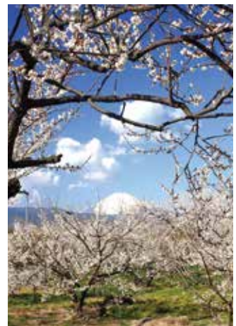
曾我梅林から望む富士山

小田原で梅干しが盛んになったのは、良質な梅に恵まれていたことと同時に、漬け込みに必要な大量の塩を相模湾の塩田から容易に手に入れることができたから。さらに、小田原は温暖な気候に恵まれ、明治時代から保養地として多くの人々が訪れたことも拍車をかけました。曾我梅林では毎年2月には「梅まつり」が行われ、梅の甘い香りを求めて、散策に訪れる人々は県内外から後を絶ちません。色とりどりの梅の花が一面に咲き誇る光景は、まばゆいばかりです。