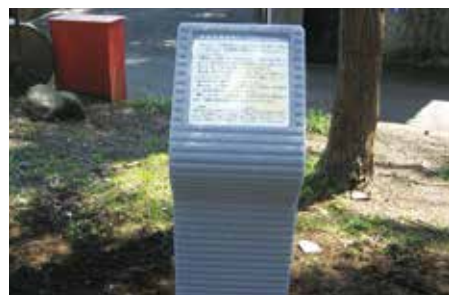
中井の昔話案内板

心地よい里山風景の残る中井町には様々な昔話が言い伝えられています。ルート上の実際の伝承地付近に案内板が設置されています。探してみよう。