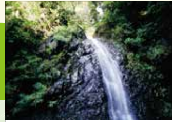
4 黒竜の滝 滝の近くに「黒竜さん」という折橋師の庵があったことからついた名ともいわれます。