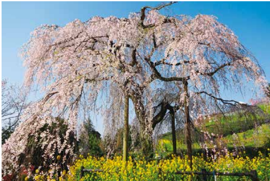
「寄五大しだれ桜」のひとつ(土佐原のしだれ桜)