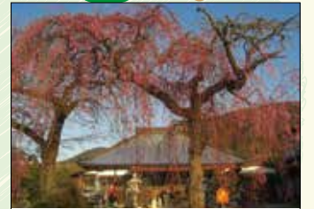
2 白泉寺しだれ桜 樹齢120年ともいわれ、4月上旬の花の時期には多くの見物客が訪れます。