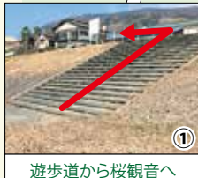
① 遊歩道から桜観音へ