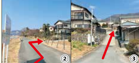
② 遊歩道から桜観音へ

ルールとアドバイス 1 ゴミは必ず持ち帰りましょう 2 植物・鳥・動物・虫などの採取・捕獲は絶対にやめましょう 3 自分に合った歩きやすい靴をはきましよう 4 水分の補給をこまめにしましよう