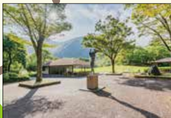
5 ダム広場 春には桜やミツマタが、秋にはモミジが見られます。