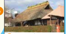
6 三保の家 ダム建設の際、水没する地区にあった茅葺屋根の家を移築したものです。