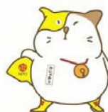
いいにゃクリエイター かになお