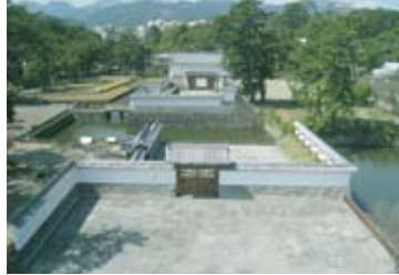
73 小田原城跡 小田原市城内ほか 小田原北条氏が本拠とした城郭。北条氏滅亡後は、徳川譜代大名の持城となった。古い記録に基づき、銅門と馬出門が復元されている。 【天守閣】⑧年末年始⑨一般400円、小中学生150円 ⑩小田原駅から徒歩10分 ⑪あり(有料) ⑫0465-23-1373