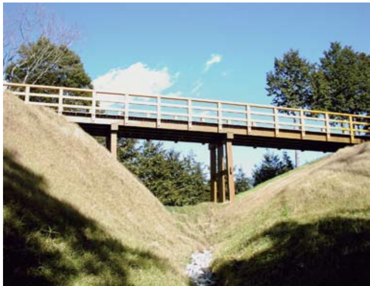
72 河村城跡 山北町山北・岸 中世、河村氏の山城

中世の河村氏の居城と伝えられる。河村氏は、藤原秀郷の末裔で相模武士波多野氏の一族。旧皆瀬川と酒匂川にはさまれた丘陵地にある山城で、中世の城郭が良く保存されている。 戦国期には、小田原北条氏の支城となり武田軍の侵入に備える要害とされたが、天正18年の北条氏の滅亡とともに廃城となつたとみられる。 現在は本城郭を中心に継続的に整備され、河村城址歴史公園となっている。名瀑・洒水の滝へつづくハイキングコースとしても親しまれている。 ⑧無休 ⑨無料 ⑩山北駅から徒歩25分 ⑪あり(無料) ⑫0465-75-3649