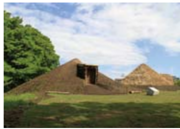
52 勝坂遺跡 縄文時代中期の大集落跡。土葺、笹葺の竪穴住居が復元されている。遺跡周辺は起伏に富んだ自然地形、湧き出る泉など豊かな自然環境が残る。 ⑧無休(管理棟は月・火、年末年始休) ⑨無料 ⑩下溝駅からバス(相武台前行)「上磯部入口」下車徒歩約5分 ⑪あり(無料) ⑫042-769-8371