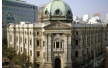
7 旧横浜正金銀行本店 明治13年に貿易の金融を目的として設立。ネオ・バロック様式の本格的な西洋建築である。現神奈川県立歴史博物館。 ⑧月曜日(祝日は開館)、資料整理休館日、年末年始⑨20歳~300円、~20歳200円、65歳~高校生100円 ⑩馬車道駅から徒歩1分 ⑪なし ⑫045-201-0926(神奈川県立歴史博物館)