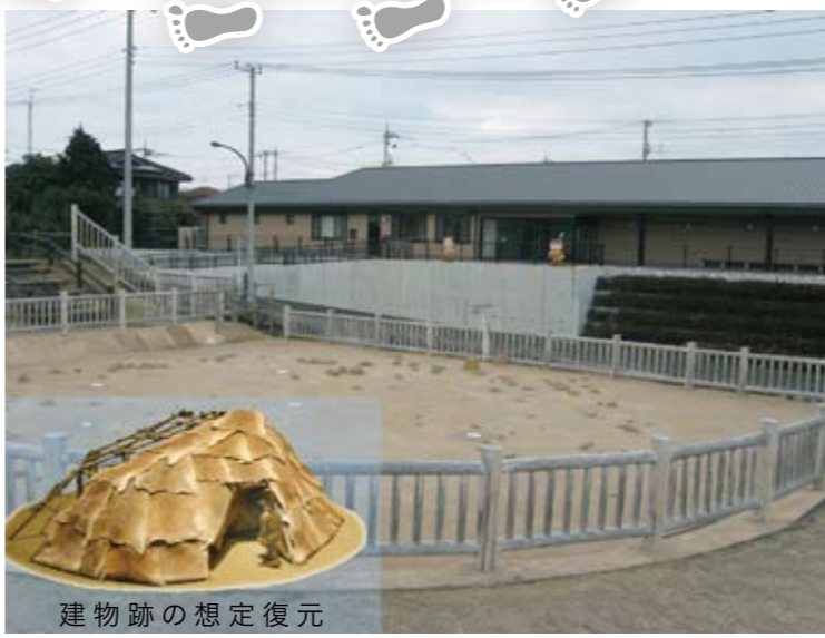
55 田名向原遺跡 相模原市中央区 列島最古 後期旧石器時代の建物跡

後期旧石器時代(約20,000年前)の建物跡が発見された。この遺構は、焼き火跡と柱の穴、さらにその周りを巡るたくさんのこぶし大の石からなっている。後期旧石器時代のものとしては、わが国最古の例である。 また、長野県や伊豆、箱根などの黒曜石で作られた石器が多く発見されており、遠隔地との交流がうかがえるなど、当時の生活の一端を示す貴重な遺跡である。 隣接する田名向原遺跡旧石器時代学習館(愛称:旧石器ハテナ館)で、出土した石器を見ることができる。講演会・体験教室なども行われている。 ⑧年末年始 ⑨無料 ⑩原麻駅からバス(望地キャンプ場入口行)「塩田下」下車すぐ ⑪あり(無料) ⑫042-777-6371(田名向原遺跡旧石器時代学習館)