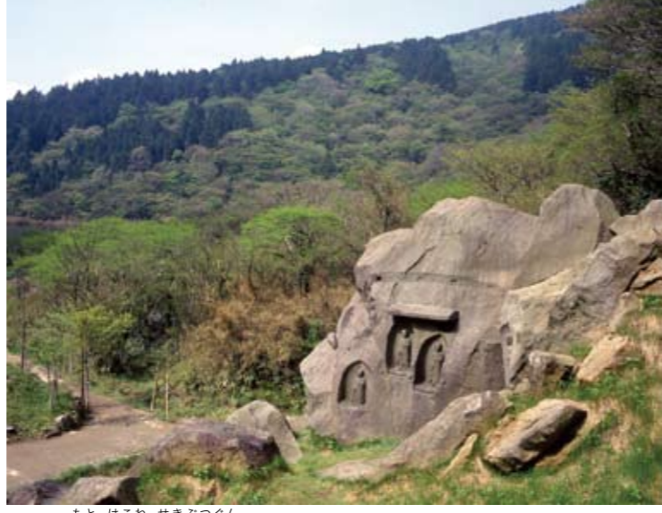
76 元箱根石仏群 箱根町元箱根 鎌倉時代の[地獄]を見守った石仏たち

精進池周辺は厳しい気候と火山性の荒涼とした景観で、地獄の地として、また賽の河原として、昔から地獄信仰の霊場であった。その地に、地藏講結縁の衆が救済や極楽浄土を願い、鎌倉時代後期に石塔や地藏磨崖仏をつきつぎとつぎついでにこの元箱根石仏群である。 周辺は史跡公園として整備され、六道地藏の覆屋も復元されている。また隣接する「石仏群と歴史館」では、各石仏の解説や伝説、周辺の回遊ルートなどを紹介している。 ⑧無休 ⑨無料 ⑩箱根湯本駅からバス(箱根町、元箱根行)「六道地藏」下車 ⑪あり(無料) ⑫0460-85-7601