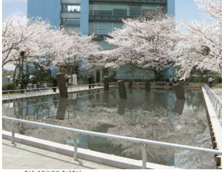
64 旧相模川橋脚 茅ヶ崎市下町屋 相模川にかけられた中世の橋脚

大正12年9月1日の関東大震災と翌年の余震による液状化現象のため、鎌倉時代の橋杭が出現した全国的にも珍しい遺跡。建久9(1198)年に源頼朝の重臣稲毛重成が亡き妻の供養のために架けた橋脚と考えられている。 平成13年から実施した保存整備に伴う調査で、橋脚の様子が確認されたほか、新たに中世の土留め遺構も発見された。橋脚の歴史的価値を伝えることに加え、地震の痕跡やこれまでの保存の歩みを残す史跡としても注目されている。 ⑧無休 ⑨無料 ⑩茅ヶ崎駅からバス(平塚駅行)「今宿」下車徒歩5分 ⑪身障者用のみあり ⑫0467-82-1111