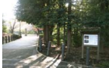
61 早川城跡 鎌倉時代の御家人で当地の領主であった渋谷氏の居城と伝えられる中世の城跡。大規模な堀切と土塁が現存する。 ⑧無休 ⑨無料 ⑩海老名駅からバス(綾瀬市役所行)「城山公園」下車徒歩0分 ⑪あり(無料) ⑫0467-70-5637