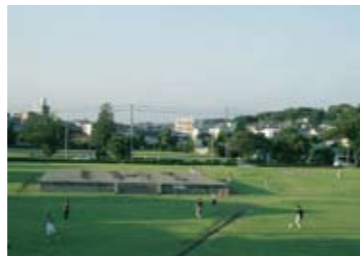
57 相模国分寺跡 法隆寺式伽藍配置をもつ日本有数の大規模な国分寺跡。伽藍の基壇や平面形が一部復元され、歴史公園となっている。 ⑧無休 ⑨無料 ⑩海老名駅から徒歩10分 ⑪なし ⑫046-235-4925

中世の河村氏の居城と伝えられる。河村氏は、藤原秀郷の末裔で相模武士波多野氏の一族。旧皆瀬川と酒匂川にはさまれた丘陵地にある山城で、中世の城郭が良く保存されている。 戦国期には、小田原北条氏の支城となり武田軍の侵入に備える要害とされたが、天正18年の北条氏の滅亡とともに廃城となつたとみられる。 現在は本城郭を中心に継続的に整備され、河村城址歴史公園となっている。名瀑・洒水の滝へつづくハイキングコースとしても親しまれている。 ⑧無休 ⑨無料 ⑩山北駅から徒歩25分 ⑪あり(無料) ⑫0465-75-3649