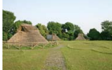
1 三殿台遺跡 縄文、弥生、古墳時代の集落跡。竪穴住居跡が約250軒も見つかった。隣接する三殿台考古館では、遺物や発掘成果を見ることができる。 ⑧第3水曜日、年末年始 ⑨無料 ⑩弘明寺駅からバス(市バス219系統)「三殿台公園」下車徒歩3分 ⑪あり(無料) ⑫045-761-4571(三殿台考古館)