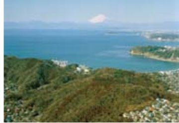
49 長柄桜山古墳群 逗子市桜山、葉山町長柄 古墳時代前期後半に築造された県内最大級の二基の前方後円墳。畿内政権の勢力拡大を示す古墳として注目される。 ⑧無休 ⑨無料 ⑩逗子駅からバス(葉桜行[逗17])「葉桜」下車徒歩8分 ⑪なし ⑫046-873-1111(逗子市)、046-876-1111(葉山町)

精進池周辺は厳しい気候と火山性の荒涼とした景観で、地獄の地として、また賽の河原として、昔から地獄信仰の霊場であった。その地に、地藏講結縁の衆が救済や極楽浄土を願い、鎌倉時代後期に石塔や地藏磨崖仏をつきつぎとつぎついでにこの元箱根石仏群である。 周辺は史跡公園として整備され、六道地藏の覆屋も復元されている。また隣接する「石仏群と歴史館」では、各石仏の解説や伝説、周辺の回遊ルートなどを紹介している。 ⑧無休 ⑨無料 ⑩箱根湯本駅からバス(箱根町、元箱根行)「六道地藏」下車 ⑪あり(無料) ⑫0460-85-7601