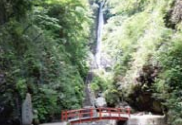
4 洒水の滝 山北町平山 雄大なその姿は古くから相模の国第一の滝とされる。鎌倉時代の名僧文覚上人が百日間も滝に打たれる荒行を積んだ地としても知られる。 ⑧無休 ⑨無料 ⑩山北駅から徒歩35分 ⑪あり(無料) ⑫0465-75-3646