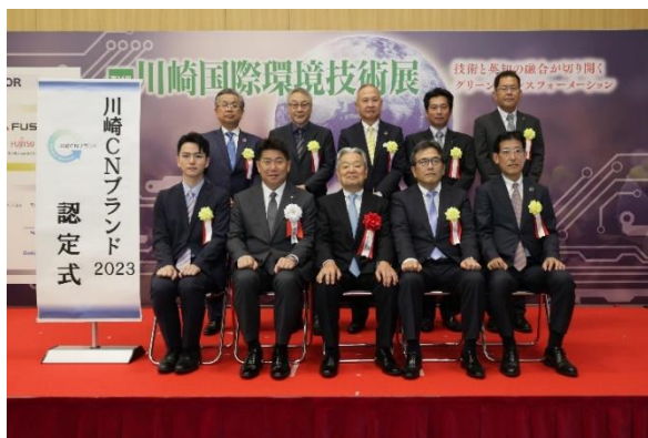
川崎CNブランド認定式