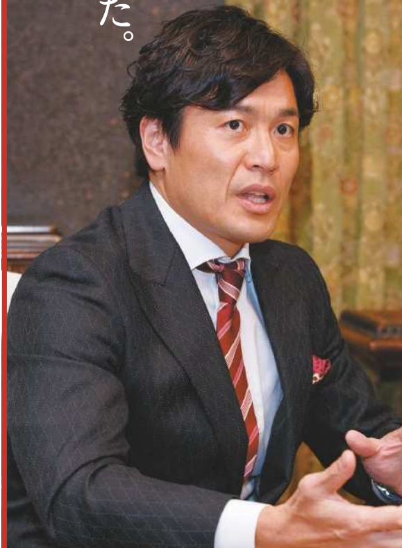
元ラグビー日本代表キャプテン 大畑 大介 Daisuke Ohata

ラグビー自体が多様性。 わかりやすい形で 見えたことで 日本中が盛り上がりました。