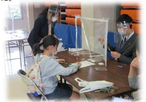
三浦学苑高校 “いしゅいしゅゴマ”

【開催場所】県立青少年センター科学部(厚木市中町4-16-21 プロミティあつぎビル2階)