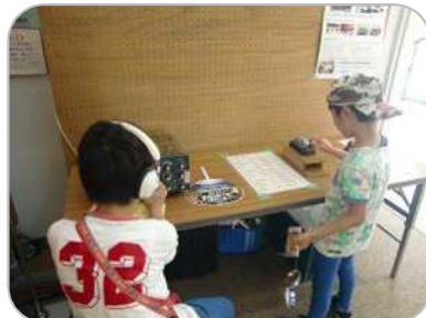
紅葉ヶ丘無線クラブ 協