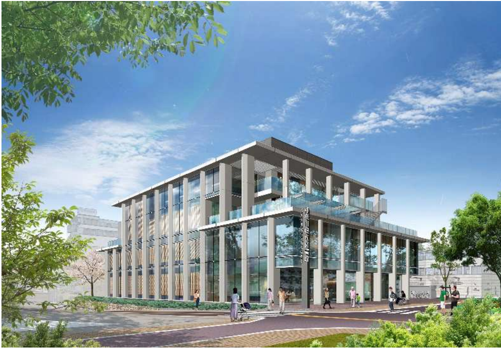
県立図書館新棟（完成予想図）