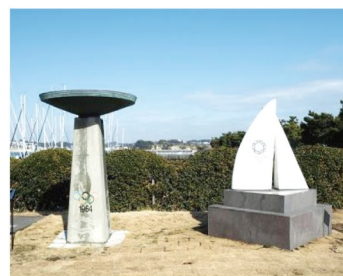
※当日イベント会場へお越しください。