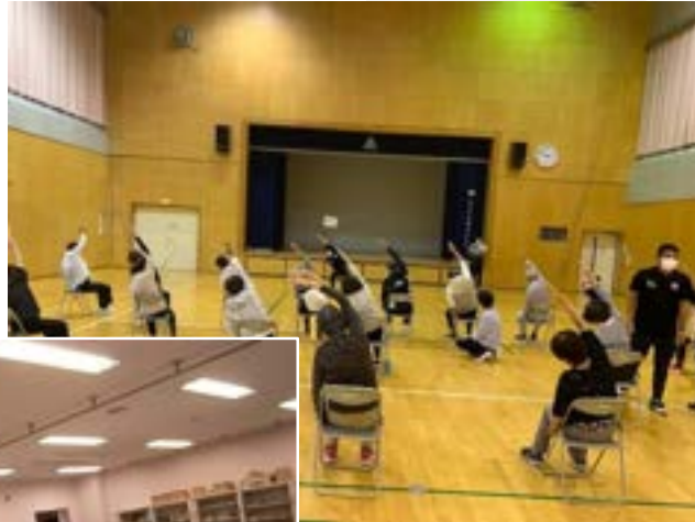
フレイル予防教室 の開講(公民館にて)