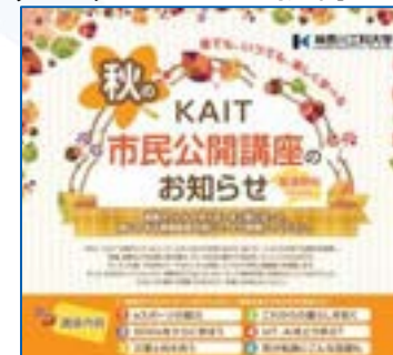
<市民向け26公開講座>