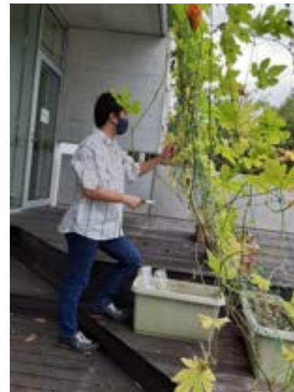
グリーンカーテンの育成