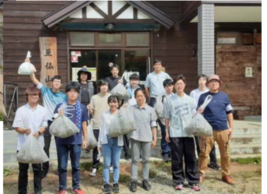
尾瀬国立公園での外来植物駆除