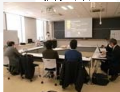
企業とリカレント教育打ち合わせ