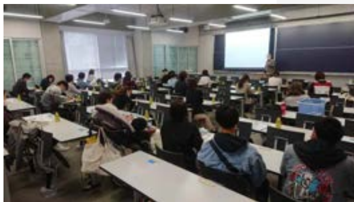
2022/11/13 「医療的ケア児における地域の 防災拠点(神奈川工科大学)の見学会」協力