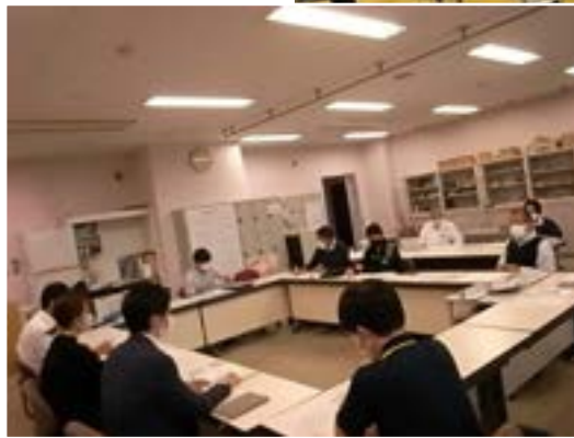
厚木市と健康福祉支援開発センター/地域連携・貢献センターの フレイル予防についてのミーティング