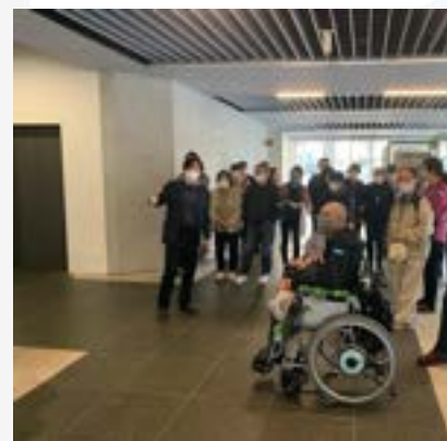
2022/11/25 「厚木市障害者協議会防災プロジェクト」 大学の避難対応見学・自己チェックリスト作成・医療 関連講義の実施