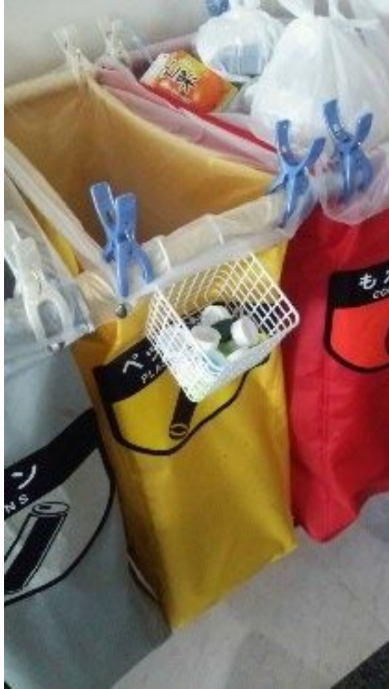
ペットボトルキャップ回収