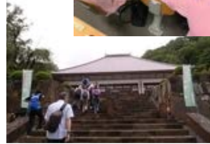
民生委員や歴史を学ぶ会の 協力で実施