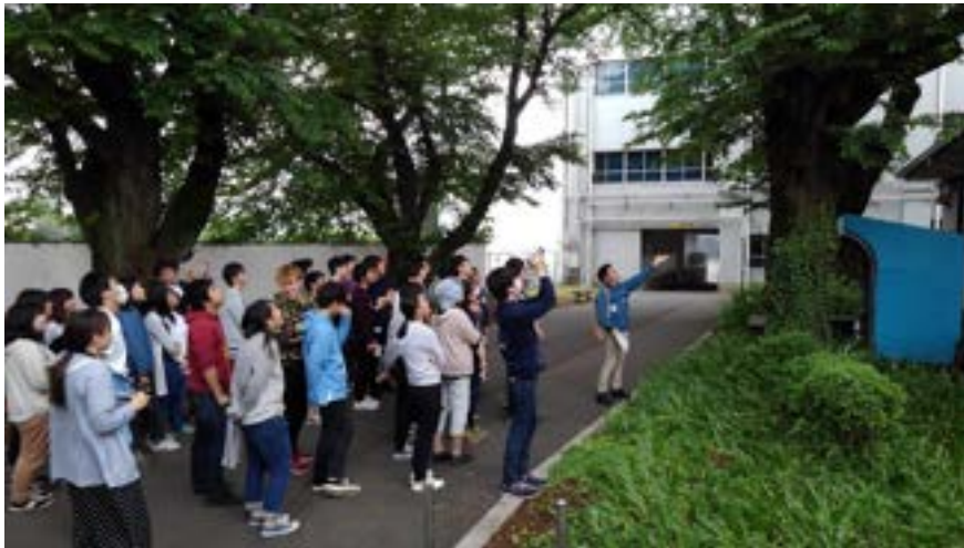
専門家を招いた桜（樹齢60年）の状態学習会