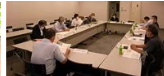
厚木商工会議所青年部の方々から教育に関するヒアリング