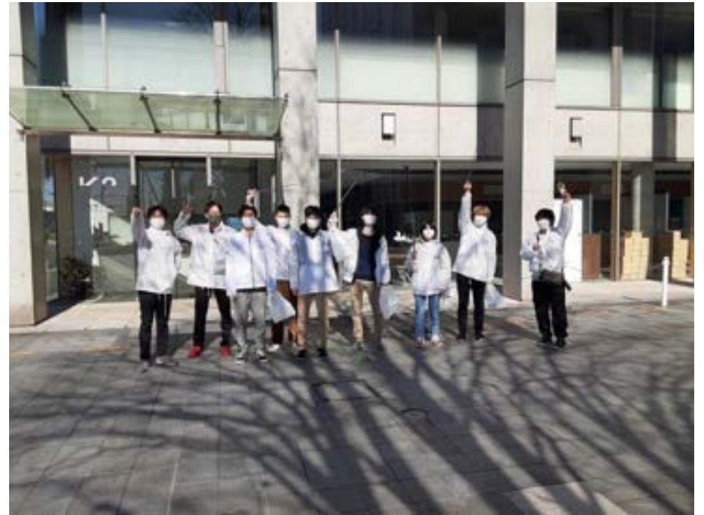
大学周辺のクリーン活動