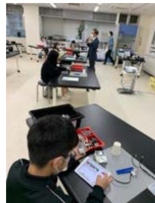
小中学校への出前ロボット教室、理科教室等