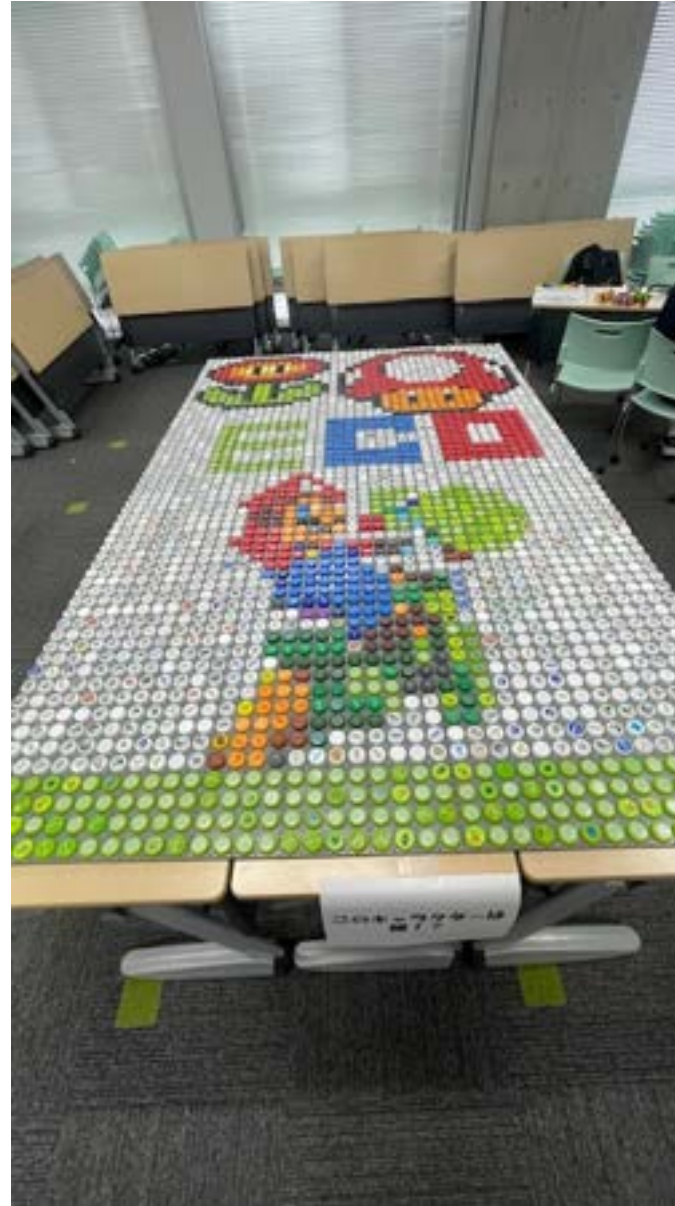
学園祭でのキャップアート展示