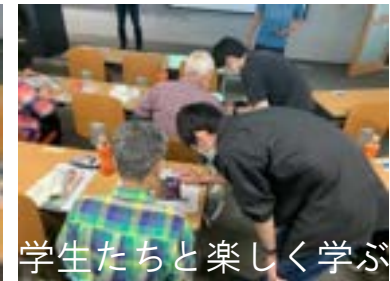
学生たちと楽しく学ぶ