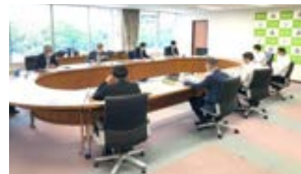
厚木市役所の方々から教育に関するヒアリング