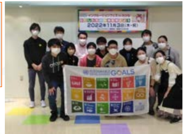
海老名のインクルージョンフェスでSDGsゲームを実施