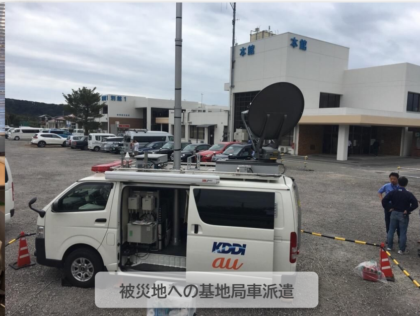
被災地への基地局車派遣