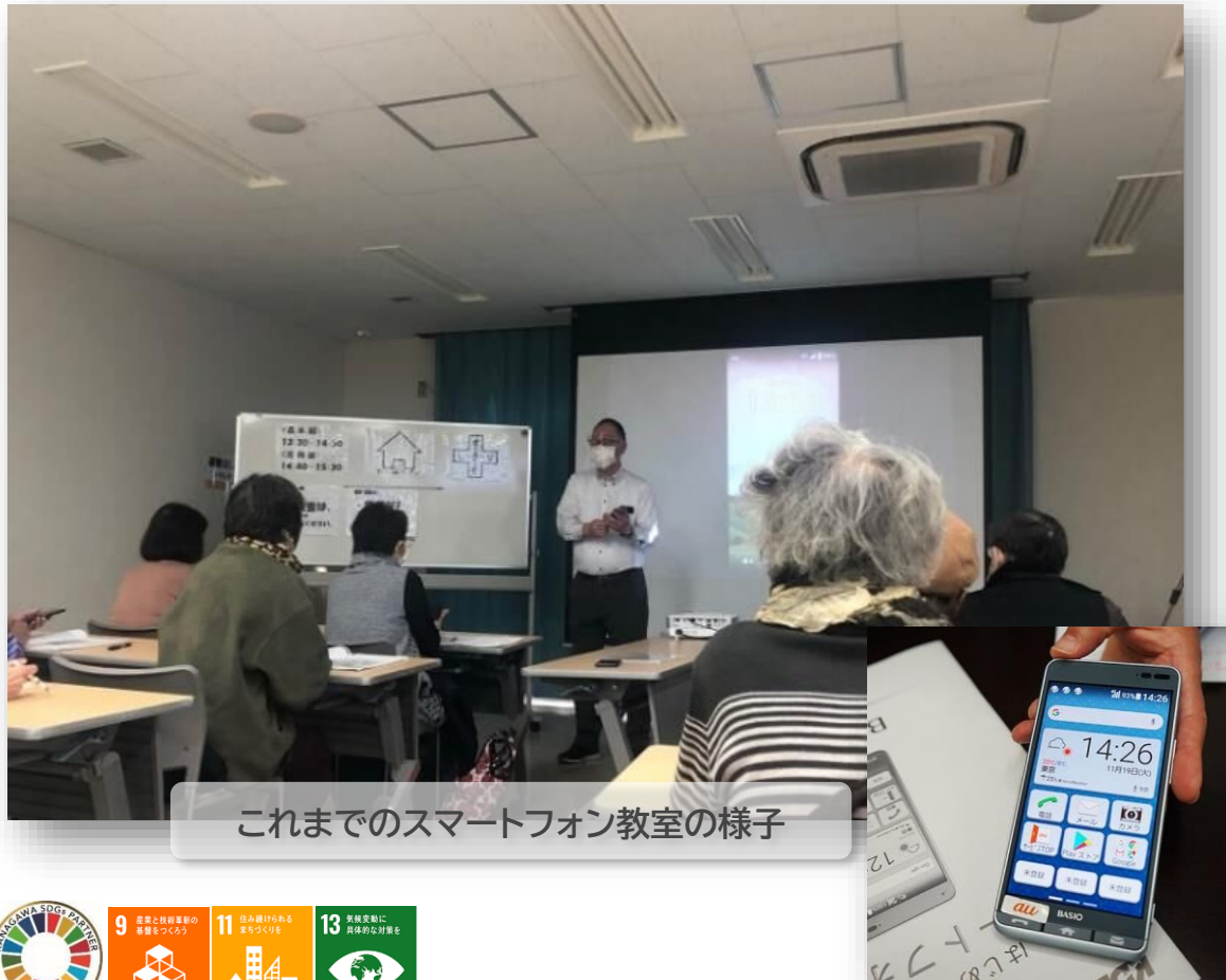
これまでのスマートフォン教室の様子