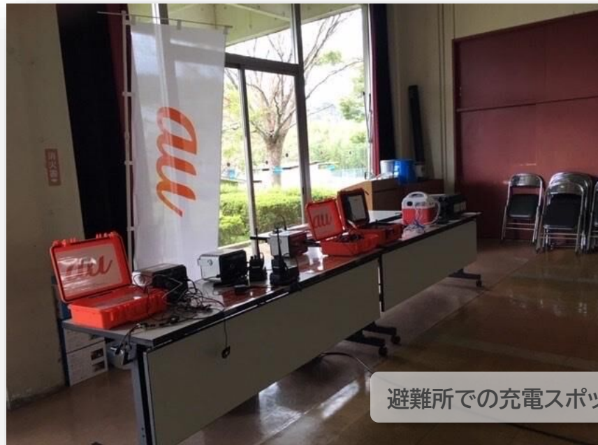
避難所での充電スポット様子