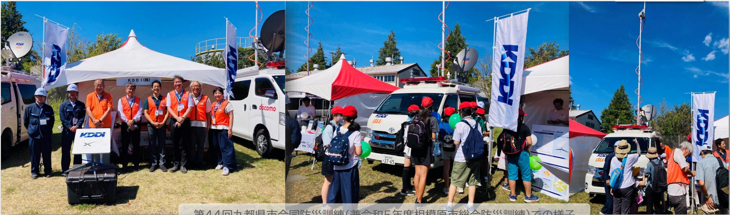
第44回九都県市合同防災訓練(兼令和5年度相模原市総合防災訓練)での様子