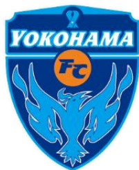
横浜FC