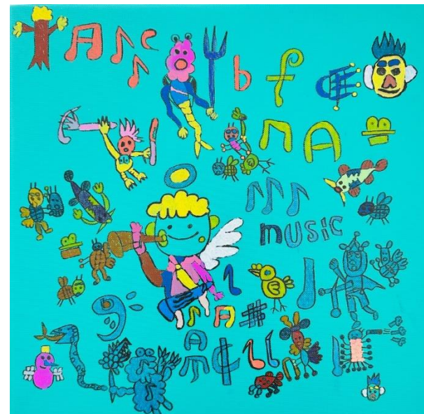
NPO法人 studioFLAT Artist:山内健資さん Title:天使と音楽