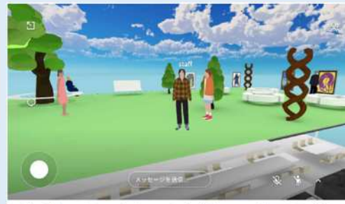
屋上ギャラリー(イベント会場として使用予定)