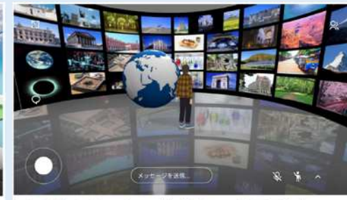
展示ギャラリー(マンガ室として使用予定)